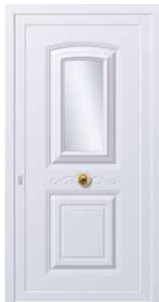
Mod. ERMES K1