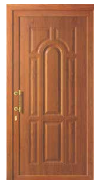
Mod. PERSEO K