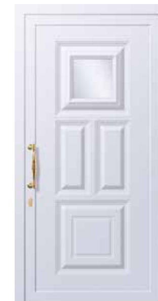
Mod. TRIADE K1