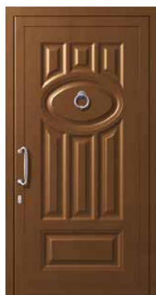
Mod. ELISI K