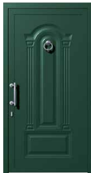
Mod. GEMINI K