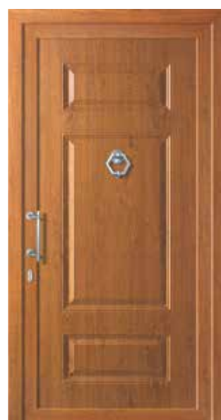
Mod. ALGENIB K