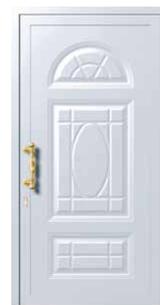
Mod. GEMMA K