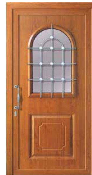
Mod. IKARO K1