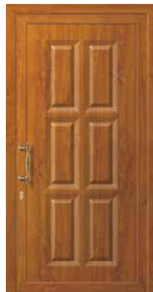
Mod. TRIADE KB