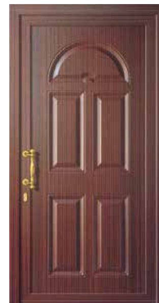
Mod. BELLATRIX K