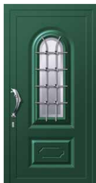
Mod. PALLADIO K1