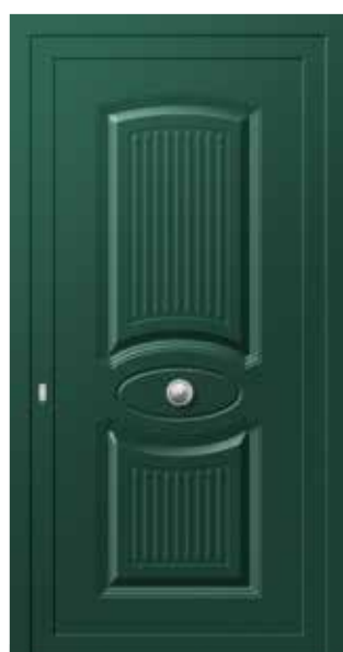
Mod. ASTRA K