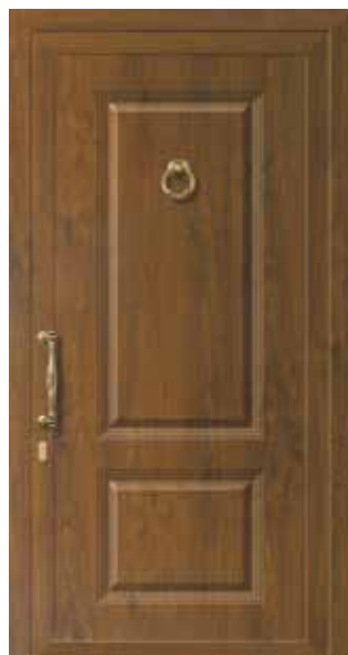
Mod. ABACO K