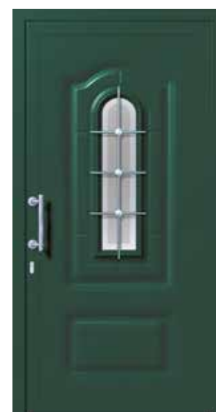
Mod. GEO K1