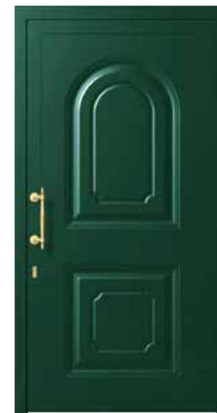
Mod. IKARO K