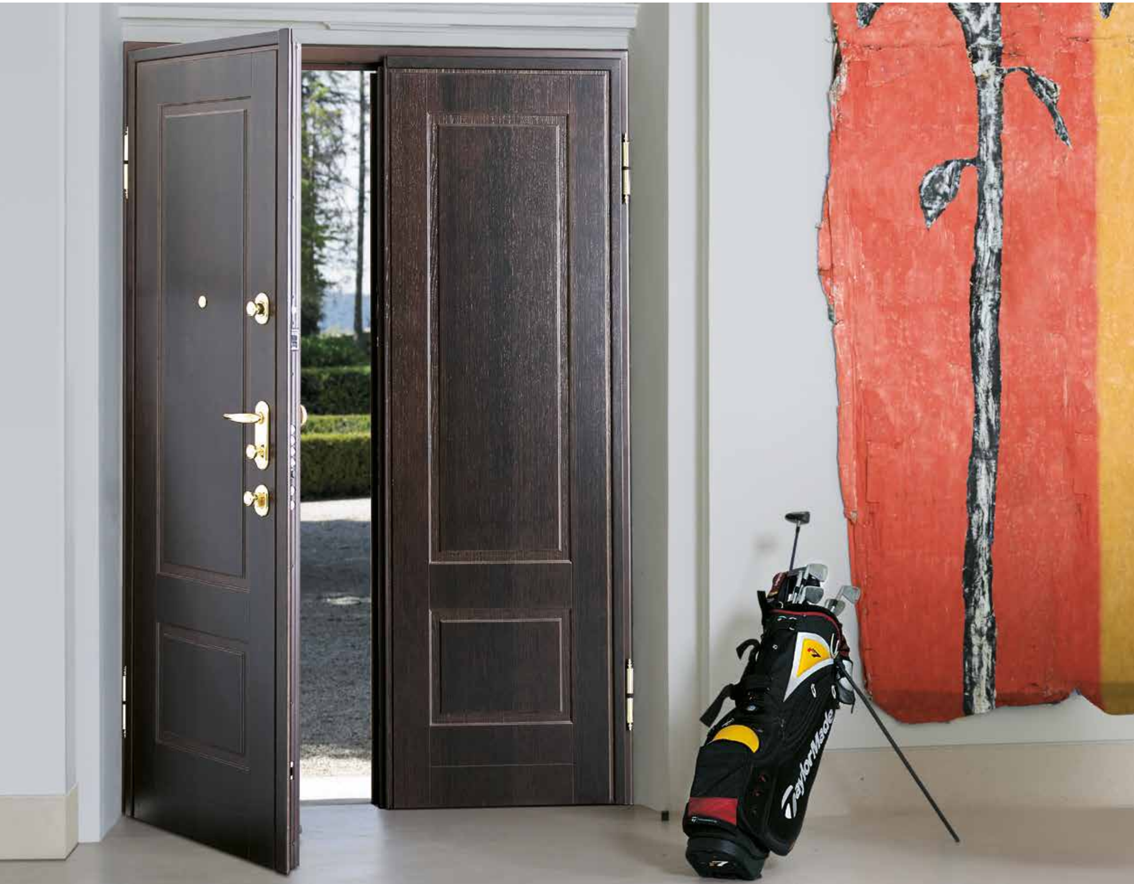
PORTONCINO , doppio battente, rivestimento interno modello TO in rovere tinto wengè, maniglia ottone, copricerniera classic finitura ottone.